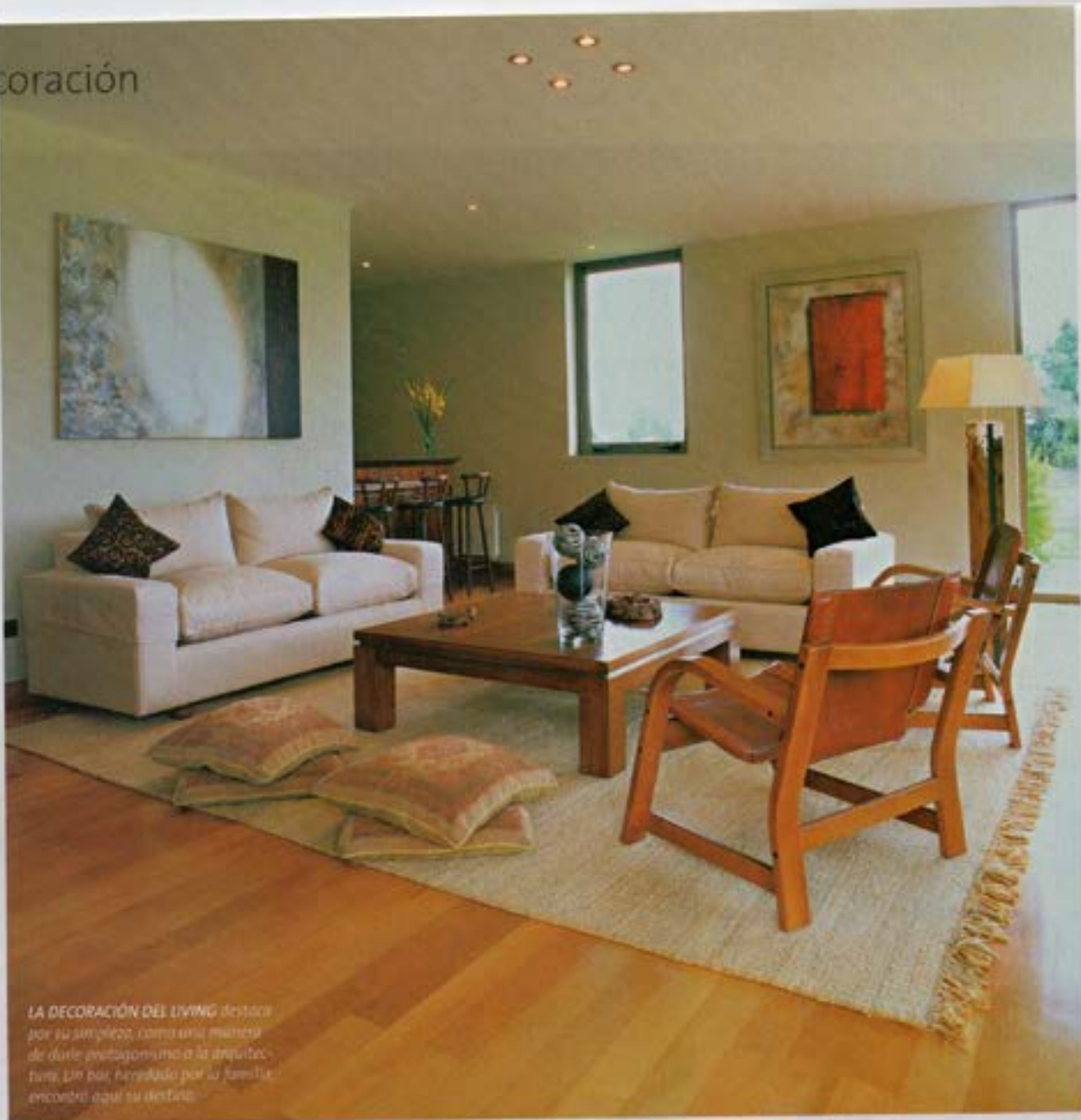
LA DECORACIÓN DEL LIVING destaca por su simplicidad, como una manera de darle protagonismo a la arquitectura. Un bar, heredado por la familia, encontró aquí su destino.

A pocos kilómetros de Pucón, en medio de la naturaleza y la tranquilidad, se encuentra esta casa de cielos altos y cómodos espacios. De estructura de hormigón y albañilería, está revestida con piedra volcánica y pino oregón en exteriores, y coigüe y madera nativa en interiores, los que se funden en ciertas situaciones. 180 metros cuadrados distribuidos en dos plantas, dejando los recintos públicos en la primera y los privados en la segunda, delatan una lectura de la zona.