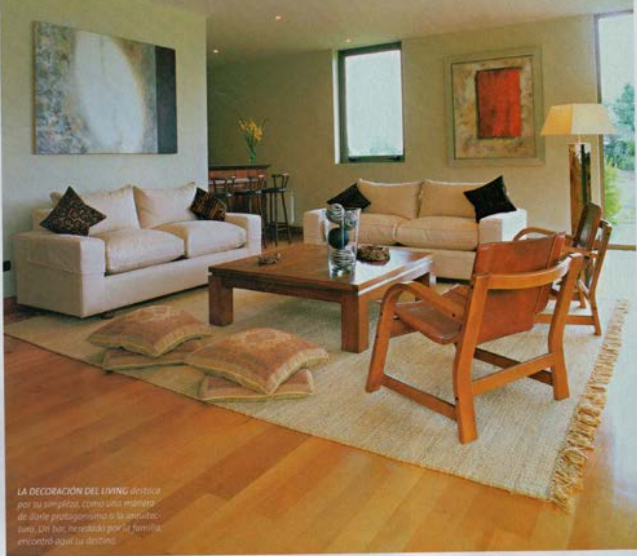
LA DECORACIÓN DEL LIVING destaca por su simplicidad, como una manera de darle protagonismo a la arquitectura. Un tal, necesitado por la familia, encontró aquí su destino.

A pocos kilómetros de Pucón, en medio de la naturaleza y la tranquilidad, se encuentra esta casa de cielos altos y cómodos espacios. De estructura de hormigón y albañilería, está revestida con piedra volcánica y pino oregón en exteriores, y coigüe y madera nativa en interiores, los que se funden en ciertas situaciones. 180 metros cuadrados distribuidos en dos plantas, dejando los recintos públicos en la primera y los privados en la segunda, delatan una lectura de la zona.